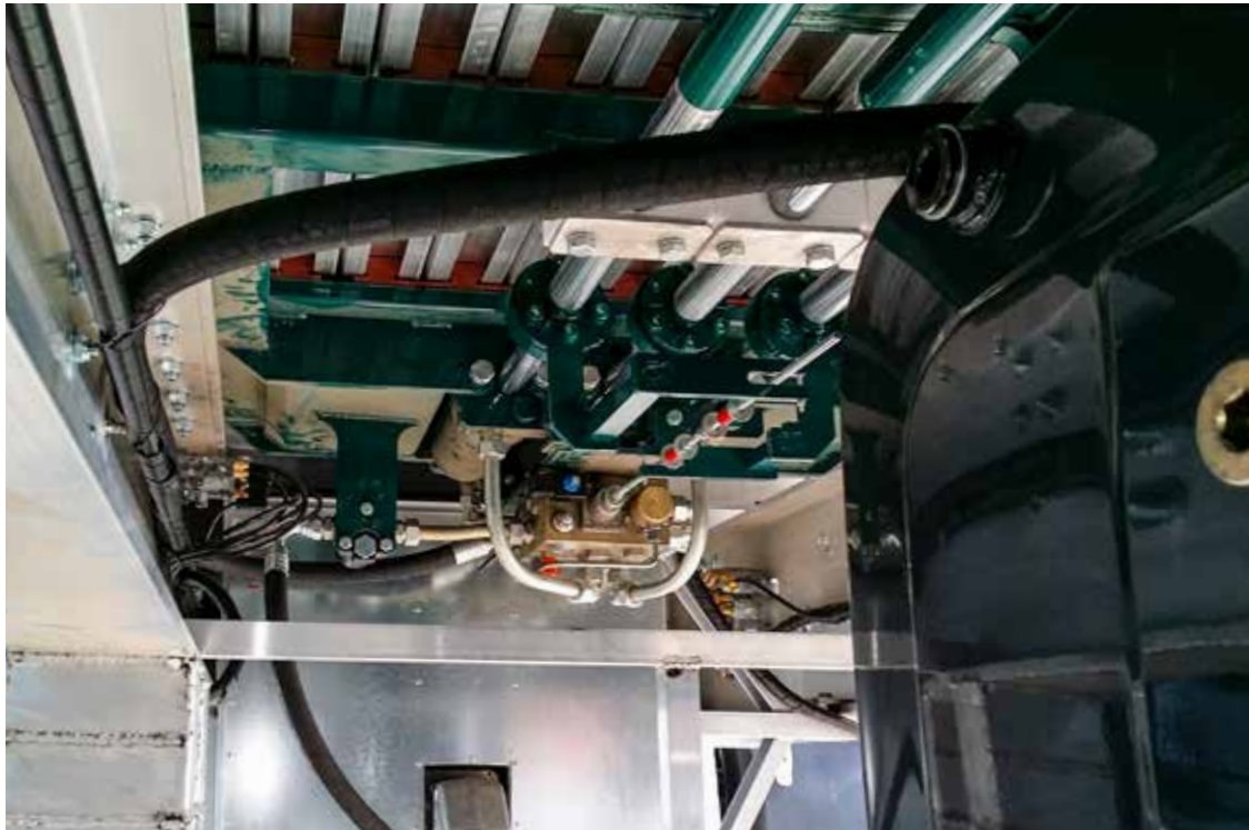
MOTOR DIESEL AUTÓNOMO PARA PISO MÓVIL