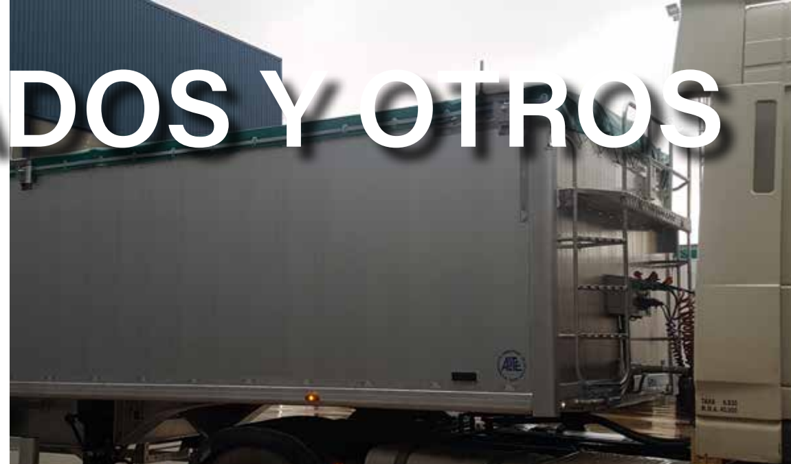
ALTURA CAJA ADAPTABLE: DE 1.400 A 3.000 mm LONGITUD CAJA ADAPTABLE: DE 10.000 A 13.650 mm