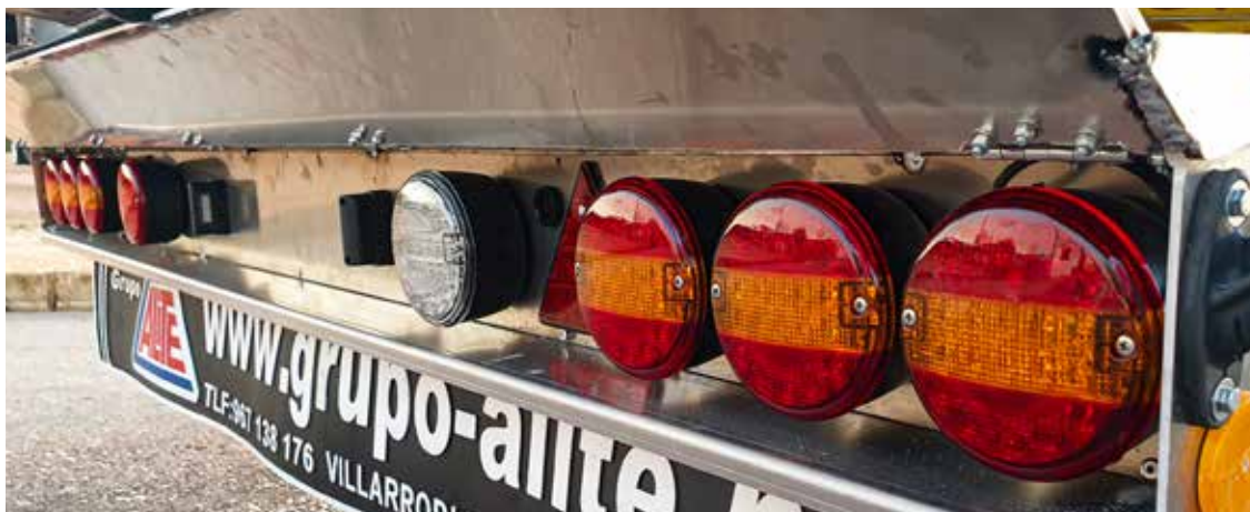
CUSTOMIZED REAR OPTICAL GROUPS