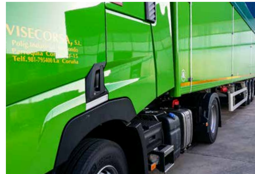
ACABADO EN CUALQUIER COLOR CARTA RAL