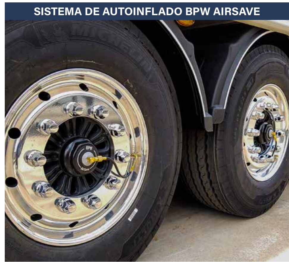
SISTEMA DE AUTOINFLADO BPW AIRSAVE