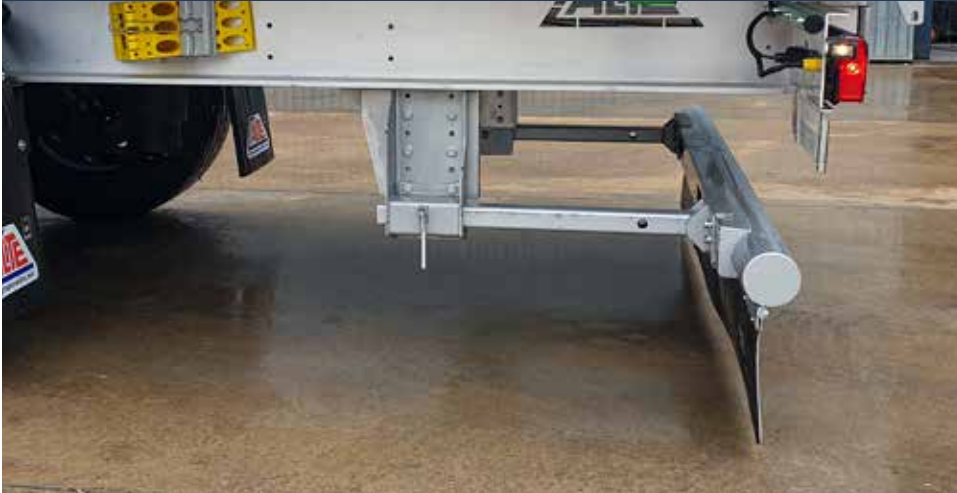
ANTIEMPOTRAMIENTO DE ACERO EXTENSIBLE