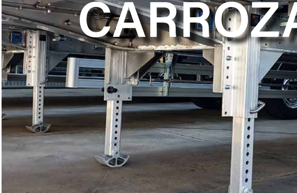
PATAS DE ALUMINIO CON EXTENSIÓN MANUAL