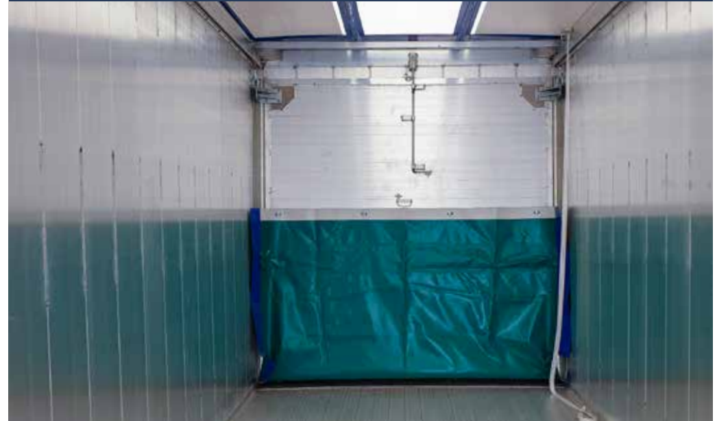
FRONTAL BARREDOR DE ALUMINIO