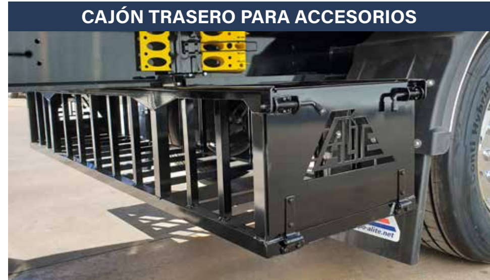
CAJÓN TRASERO PARA ACCESORIOS