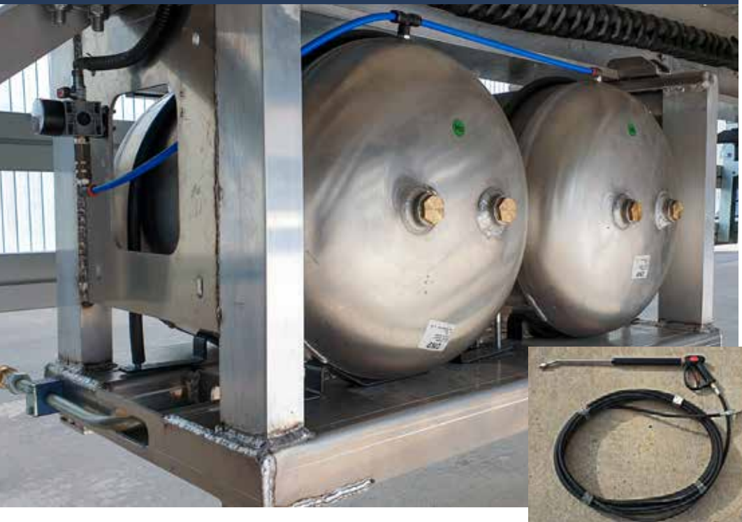
SISTEMA DE LAVADO